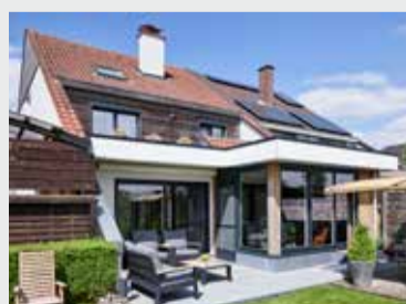
RENOVATIE HAALTERT (BE) ELEGANT INFINITY + ELEGANT MONORAIL Ref. Antracietgrijs mat — Installateur: Bauwens