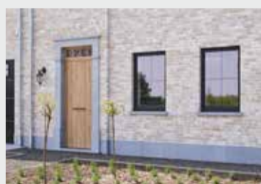
NIEUWBOUW SINT-GILLIS-WAAS (BE) ELEGANT THERMOFIBRA INFINITY Ref. Crèmewit — Installateur: De Clerck Bouwpartner: VR Build bvba