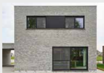
NIEUWBOUW POPERINGE (BE) ELEGANT INFINITY + ELEGANT MONORAIL Ref. Grafietzwart mat — Installateur: P&S Projects Bouwpartner: Catteeu