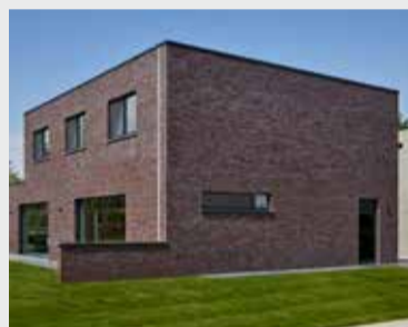
NIEUWBOUW POPERINGE (BE) ELEGANT INFINITY Ref. Grafietzwart mat — Installateur: P&S Projects Bouwpartner: Catteeu