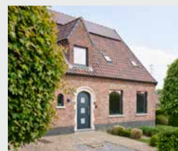
RENOVATIE TEMSE (BE) ELEGANT INFINITY Ref. Antracietgrijs glad — Installateur: Deram Systems Temse