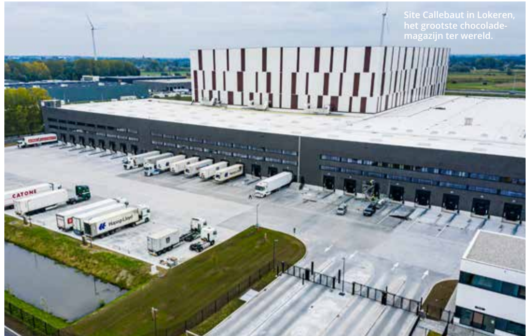
Site Callebaut in Lokeren, het grootste chocolademagazijn ter wereld.