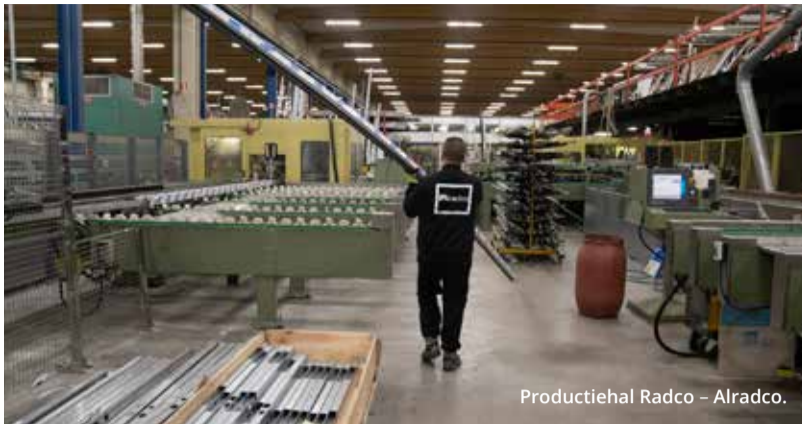
Productiehal Radco – Alradco.