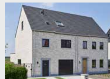
NIEUWBOUW SINT-GILLIS-WAAS (BE) ELEGANT THERMOFIBRA INFINITY Ref. Grafietzwart mat — Installateur: De Clerck Bouwpartner: VR Build bvba