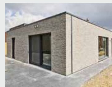
NIEUWBOUW POPERINGE (BE) ELEGANT INFINITY Ref. Leigrijs glad — Installateur: P&S Projects Bouwpartner: Catteeu