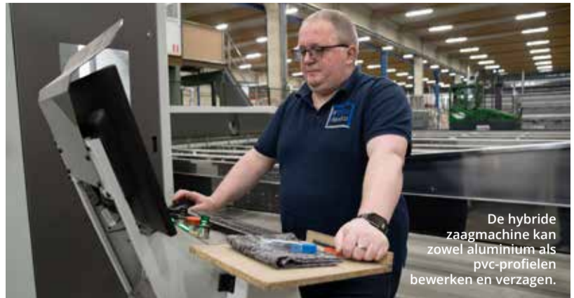
De hybride zaagmachine kan zowel aluminium als pvc-profielen bewerken en verzagen.