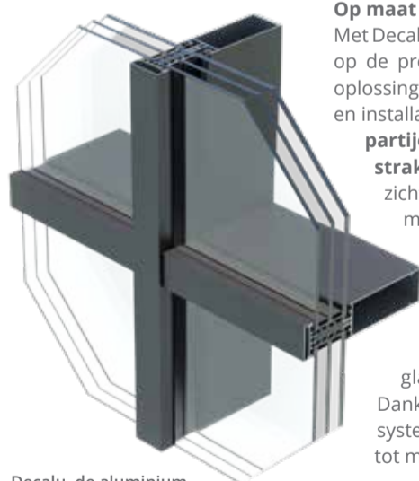
Decalu, de aluminium reeks van Deceuninck, wordt aangevuld met een vliesgevelsysteem dat op Polyclose in primeur gelanceerd wordt.

Deze glasgevelprofielen zijn verkrijgbaar in diverse kleuren en afmetingen, met zowel RAL-kleuren, structuurlak als anodisatie. Goed om te weten: 16 van deze kleuren zijn ook verkrijgbaar in het Elegant kunststofgamma van Deceuninck, waardoor we Elegant kunststoframen naast Decalu F50 Facade kunnen toepassen. En om de designmogelijkheden helemaal te benutten, heb je als installateur de keuze uit verschillende afdekprofielen, van rechthoekig tot helemaal op maat van de klant. ■